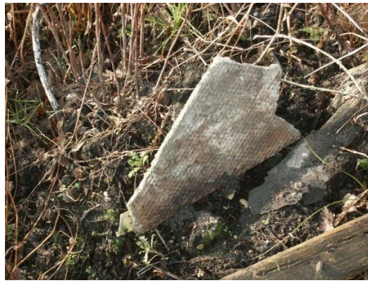
Typische foto's van asbest in de grond