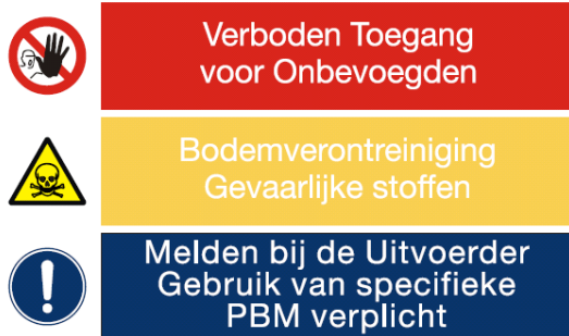
Bebording op de saneringslocatie